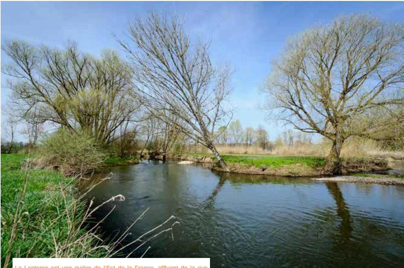
La Lanterne est une rivière de l'Est de la France, affluent de la rive gauche de la Saône, et sous-affluent du Rhône.