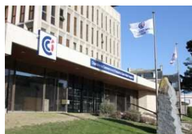
Chambre de Commerce et d'industrie de Saint Malo