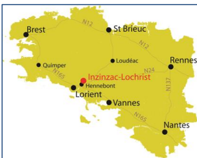
Inzinzac-Lochrist, situé à 20 min au Nord-Est de Lorient