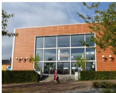
Le Théâtre du Blavet « Trio », situé sur la place centrale de Lochrist